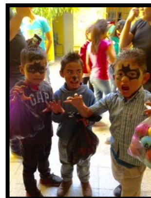
The Three Supermen