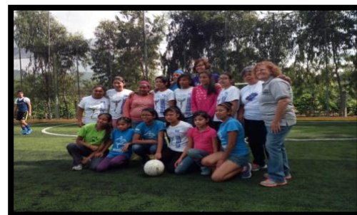
Nuestro equipo femenino. ¡Lindas todas ellas!