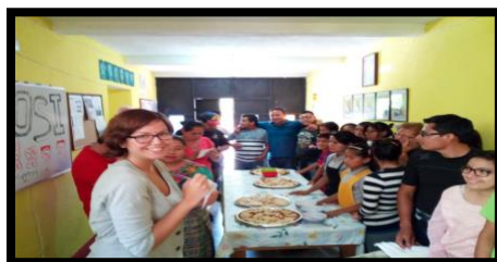
Unión de Chefs internacionales...qué lujo!!!

El viernes 9 a las nueve de la mañana dio inicio la actividad deportiva. Participaron los estudiantes del Colegio Tridentino, de la Asociación Los Patojos y LAVOSI. Cada establecimiento con dos equipos, uno femenino y otro masculino. Vivimos una mañana de hermandad estudiantil y juvenil, en un marco de respeto y sana competencia. La actividad concluyó al filo del medio día y con ella culminó la celebración del VIII Aniversario de nuestra querida Escuela. Sinceros agradecimientos a los directores y directoras de los establecimientos que aceptaron nuestra invitación para participar en la mañana deportiva. Mil agradecimientos.